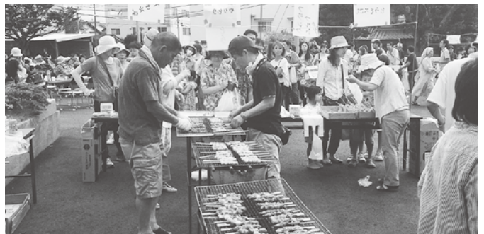
焼き鳥の屋台の前は大行列。焼いても焼いてもすぐに売れてしまいました。