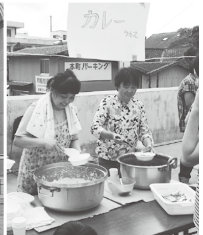
カレーもたったの 100 円! あっという間に売り切れです…。