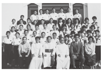
濱崎師 堅信式にて