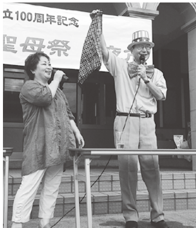
恒例の下口神父様によるマジックショー。帽子と蝶ネクタイが似合ってます。