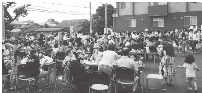
百周年にちなんで、ほとんどの商品が 100 円以下! 例年を遙かにしのぐ人手に教会境内はすぐに一杯になりました。