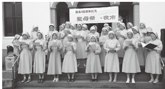
シスターによる美しい合唱が夜市に花を添えました。