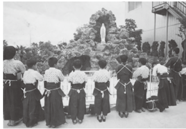
ルルドでお祈りをする剣道道場「雅風会」のこども達

叙階。福岡の大神学校で教鞭をとっていたが、昭和四四年九月、福江教会助任として着任。昭和四六年一月主任となり、昭和五八年三月まで十二年間福江教会で司牧した。師は第二バチカン公会議の教えに基づいて信徒使徒職評議會を発足させ、各種委員会を設立。小教区報「こころ」の発刊をするなど、現在の教会の基礎を創った。五島初のクルシリヨ、神学者や聖書学者を呼んでの要理講習会、宗教講座、聖書講座など、信徒の要理への理解を深めさせた。青少年の健全な育成にも努められ、その成果として多くの司祭、修道者が誕生した。また、「キリストの愛の教えと剣道の精神は一致する」と判断。旧・