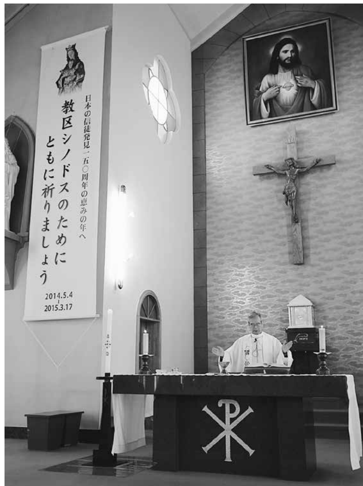
主任司祭 下口 勲