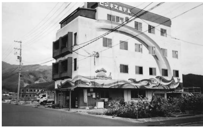
カリタスジャパンの大槌ベースキャンプ